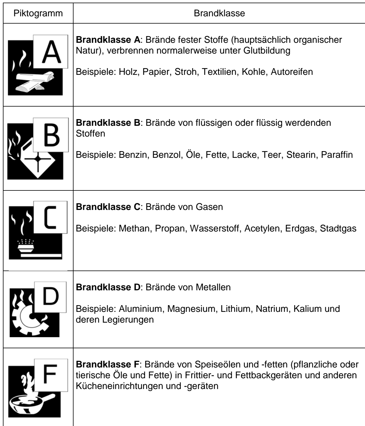
Tabelle 1: Brandklassen nach DIN EN 2 „Brandklassen“ Ausgabe Januar 2005