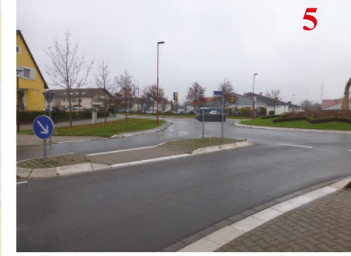
Achtung: Hier biegen viele Busse und PKW ab!