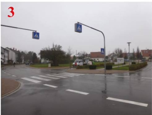
Dieser Zebrastreifen sollte genutzt werden.