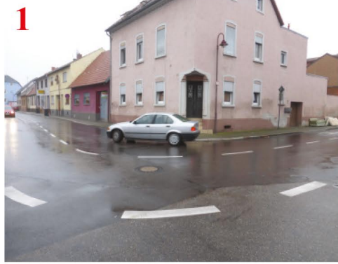
Achtung: Hier biegen viele Lkw und PKW ab!