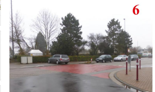
Hier parken oft Autos den Überweg zu!