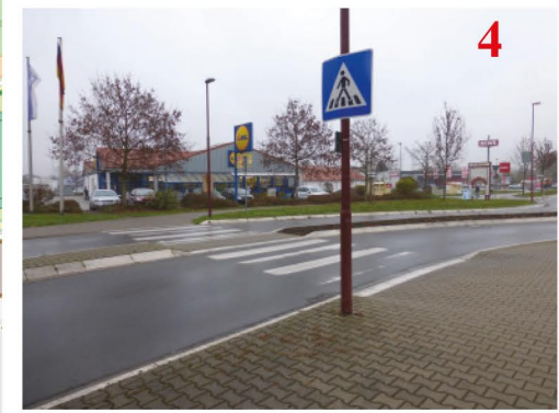
Dieser Zebrastreifen sollte genutzt werden.