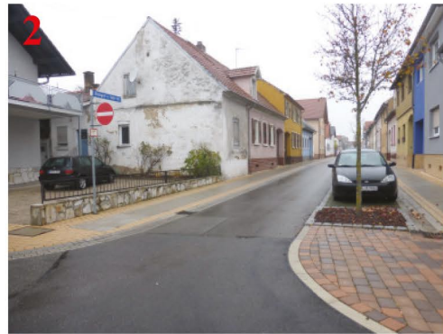
Achtung: Hier fehlt eine Überquerungshilfe!